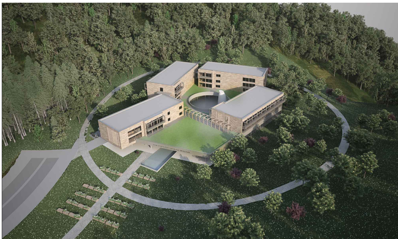
SHEMATSKI PROSTORSKI PRIKAZ